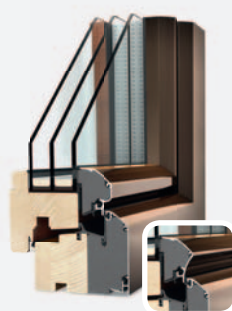
HF 300 EDITION