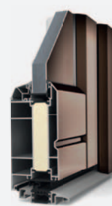
AT 200 PORTAL