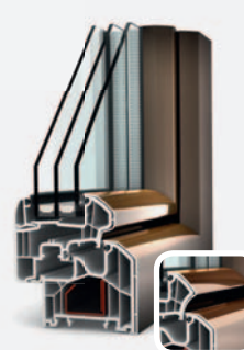
KF 300 DIMENSION+