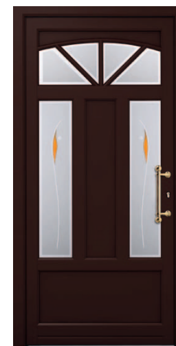
AT 200 design ET-M5B