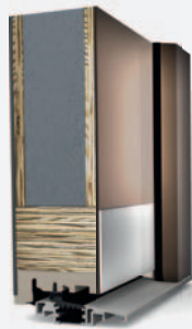
HT 300 SELECTION 2