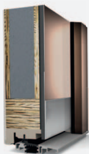
HT 400 SELECTION