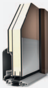
AT 300 LINEA