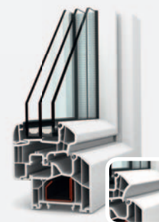
KF 300 DIMENSION+