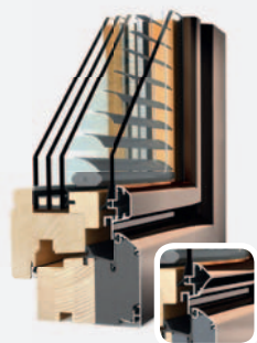
HV 340 EDITION 4